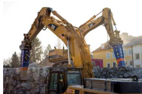
Baustelle München: Abbruch eines Vorkriegs-Fernmeldebunkers