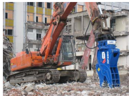
Baustelle Wien: Abbruch alter Postkomplex Südbahnhof